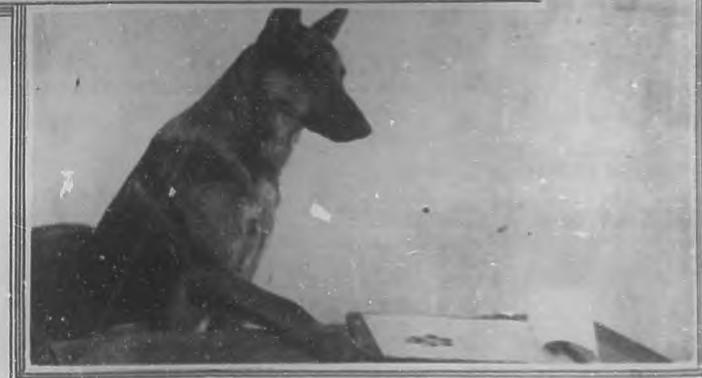
Arriba:—Un alto en la filmación de "Barreras rotas".—Abajo:—"Pedro el Grande", que está filmando "El Silencio acusador".