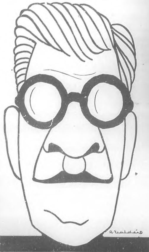
GRAL. GERARDO MACHADO

Las declaraciones de un candidato a la presidencia de la República—nos dijo el general Machado—implican, aunque no sea ese su propósito, una oferta al país, un compromiso solemne adquirido libremente. Yo no quiero en las manifestaciones que me pide BOHEMIA señalar procedimientos, porque eso depende del acuerdo que tenga con mis futuros colaboradores, puesto que a mí me corresponde, exclusivamente, el dar las orientaciones que otros deben llevar a la práctica; pero en sentido general no tengo el menor escrúpulo en darle a conocer al país mi manera de pensar sobre los asuntos fundamentales y las soluciones que habrán de alcanzarse durante el período