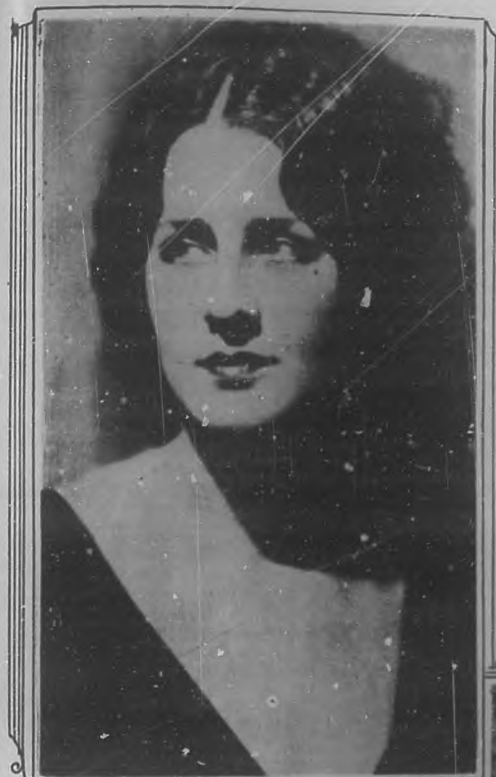
Norma Shearer, principal protagonista de "Barreras rotas".