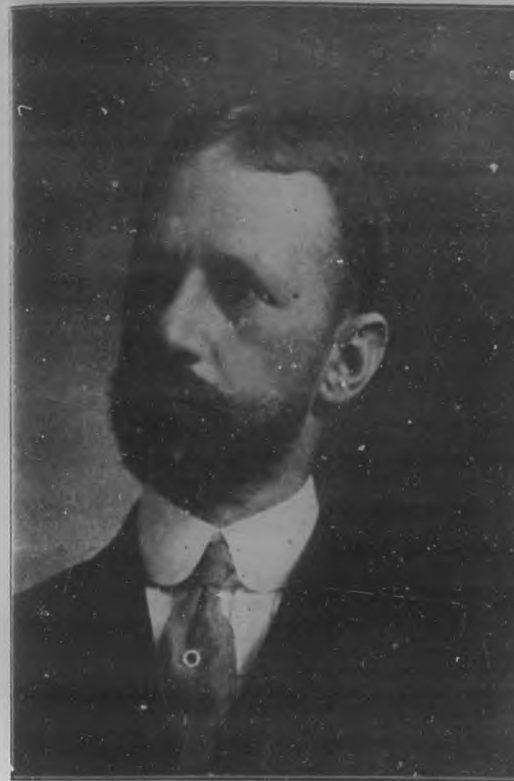
GRAL. MARIO G. MENOICAL

Ilustre caudillo, candidato del Partido Conservador a la Presidencia de la República en las próximas elecciones.