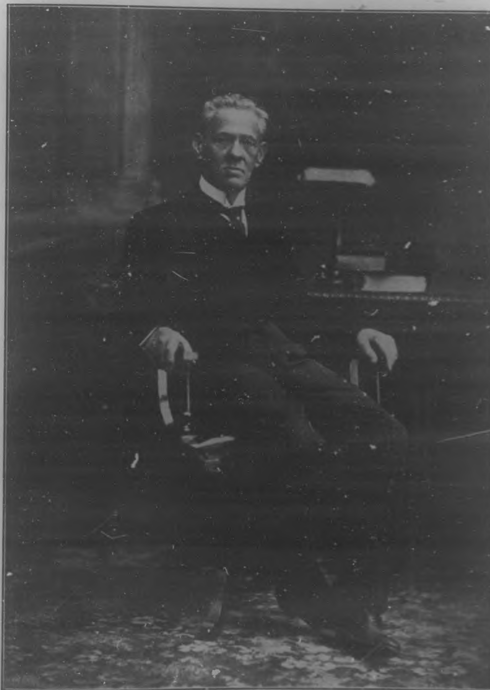
DR. ALFREDO ZAYAS Y ALFONSO

Redacción, Administración y Talleres: Edificio de BOHEMIA, América Arica Calle Comercio No. 95 y 96 Teléfono: 17-1111 M-1121; Administración, A-9564