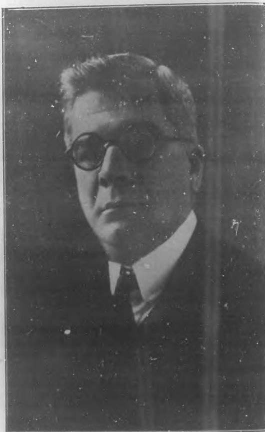
GRAL. GERARDO MACHADO

Al Congreso puede pedirle leyes; a mí, administración. Pero como es in-